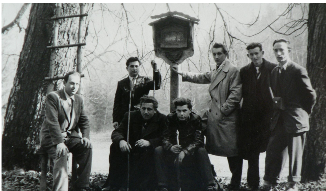
Historické foto ze stejné vycházky z cca 50-60 léta