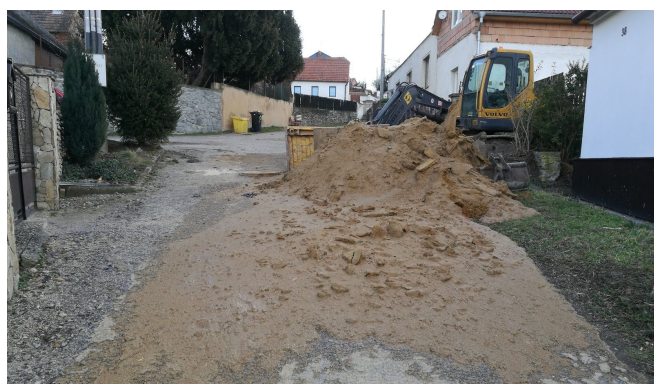
... s problematickými tekutými písky "v uličce"