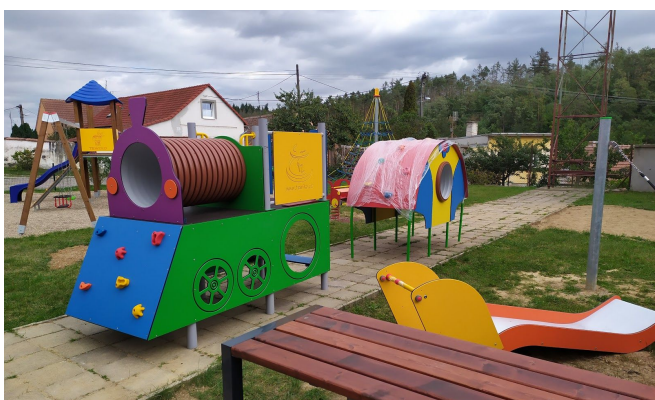
Dětské hřiště na Pelánově kopečku