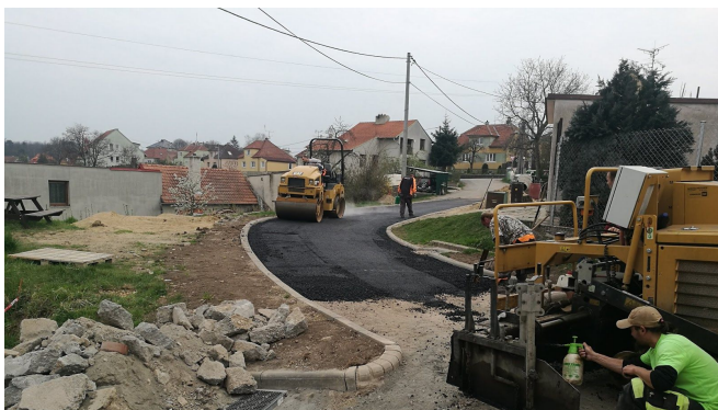
Obnova komunikace Na Kopci (2.část)