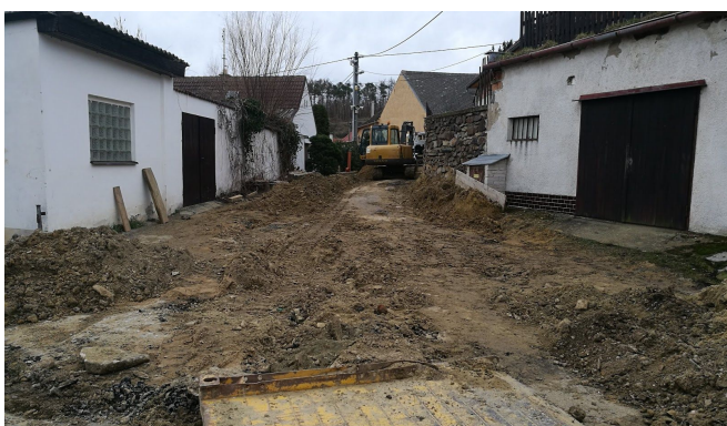
Dostavba chybějícího úseku kanalizace