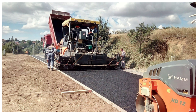
... a nový povrch silnice k ZD