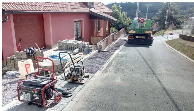
... a obnova chodníku