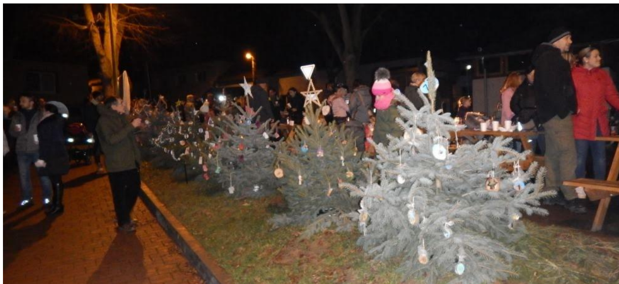
Obr. Zimní jarmark a rozsvěcení vánočního stroměčku, r. 2019