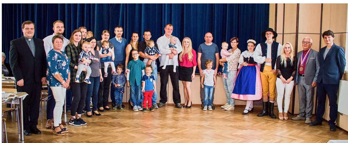
Obr. Vítání občánků 19. září 2021