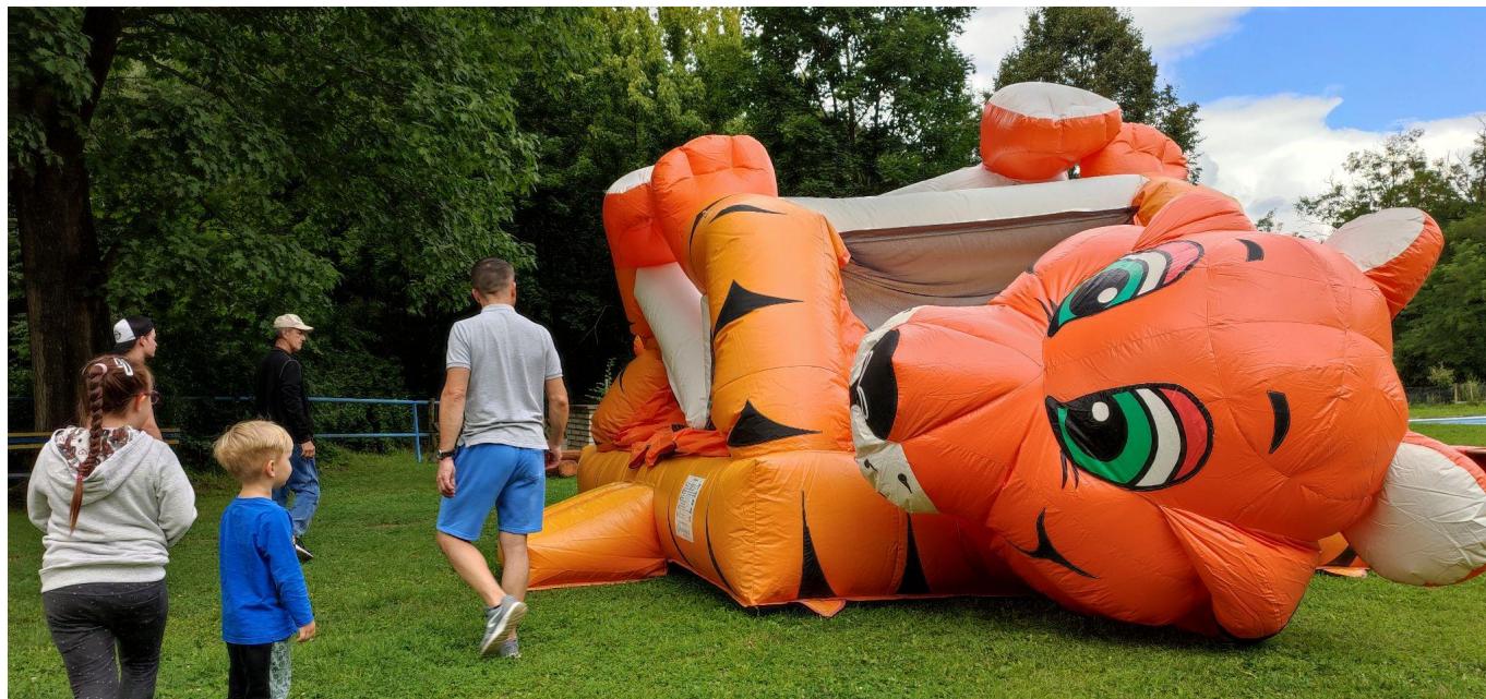
Obr. Nafukování skákacího hradu na akci Rozloučení s prázdninami