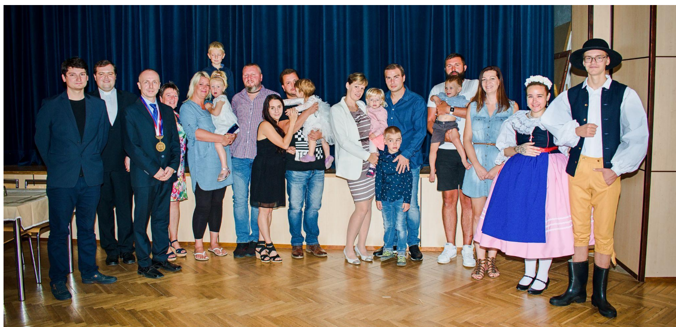
Obr. Vítání občánků 12. září 2021